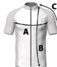
Table de mesures:

Poche au dos de 3 compartiments et 1 poche sippée. Bas avec liseré devant et grip de 4cm derrière.