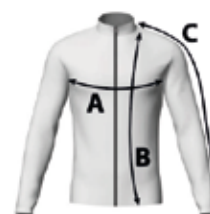
Table de mesures: