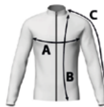
Table de mesures:

Manches longues raglan. Zip complet semi-automatique. Col haut de 4 cm. Bas manches et maillot avec couture de 2cm avec élastique. Tissu Chiffon 65 GSM coupevent et imperméable Style Mixte